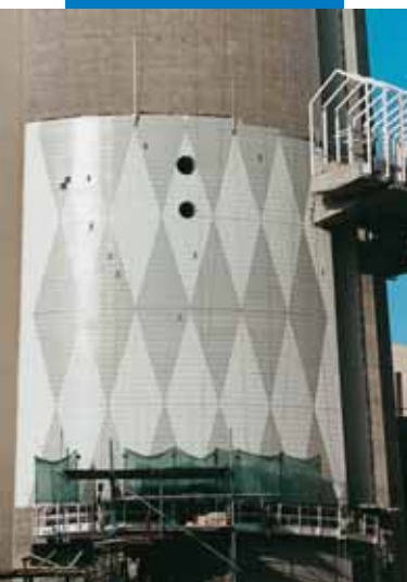
Пример укладки клинкера поверх бетона с помощью Kerabond T + Isolastic. Новая телекоммуникационная башня в Кувейт - сити (Кувейт)