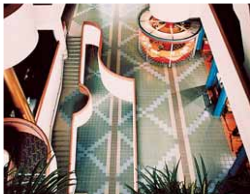
Фарфоровая неглазурированная плитка, укладываемая с помощью Kerabond T + Isolastic Общественное здание – Город Норс Йорк Онтарио (Канада)