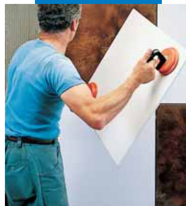
Укладка Keraion на стену